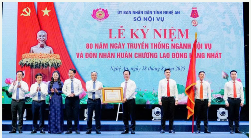
Theo Cổng thông tin điện tử Sở Nội vụ tỉnh Nghệ An Mai Dung tổng hợp

Nhân dịp này, ngành Nội vụ Nghệ An vinh dự được Chủ tịch nước trao tặng Huân chương Lao động hạng Nhất; nhiều cá nhân được tặng thưởng Huân chương Lao động, Bằng khen của Thủ tướng Chính phủ, danh hiệu Chiến sỹ thi đua cấp tỉnh và Bằng khen của Chủ tịch UBND tỉnh.